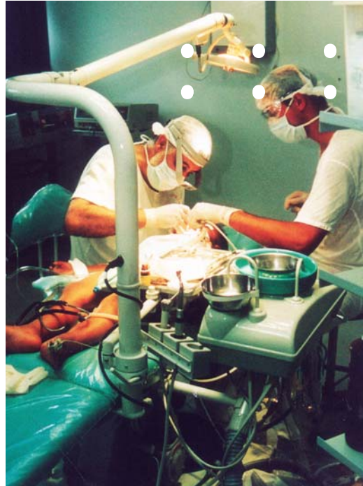
Reabilitação realizada na unidade portátil com anestesia geral Rehabilitation performed in the movable unit under general anesthesia

Para a obtenção dos resultados, são fundamentais as aplicações dos procedimentos e a frequência das crianças que estão em tratamento. Para isso, semanalmente e de acordo com escalonamento pré-estabelecido, a criança freqüenta a unidade acompanhada dos pais ou do responsável para a realização da escovação supervisionada, bochecho com flúor e uso de fio dental. Nesse período, recebe a orientação necessária para manutenção de uma boca saudável. Periodicamente, a criança é submetida à evidenciação de placa bacteriana antes da escovação. A cada três meses, é aplicado o flúor-gel tópico e, semestralmente, as escovas de dente são trocadas. Todo o material é fornecido gratuitamente às crianças. •